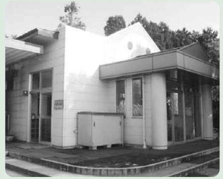
わくわくポケット外観▲