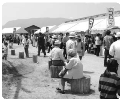
▼ふれあい子ども動物園

いろいろなイベントや地元物産、花苗の販売、飲食店などが催され、多くの方でにぎわいます。