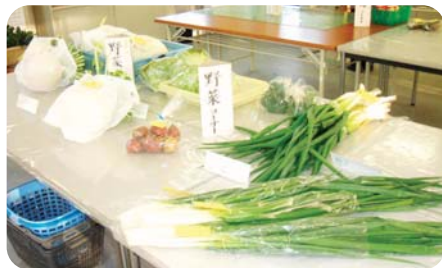
▲地元で採れた季節の野菜が並びます

ふじのいち、藤原町の篠立パーキング駐車場の一段上に建てられた販売所です。藤原町内の農家、12~13人のメンバーで活動しています。皆が一生懸命育てた野菜などを中心に、シイタケ、タマゴ、納豆も販売していて、特に納豆は開店から30分程で完売してしまうくらい好評です。