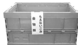
もえないごみ 金物類