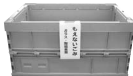
もえないごみ ガラス・陶磁器類