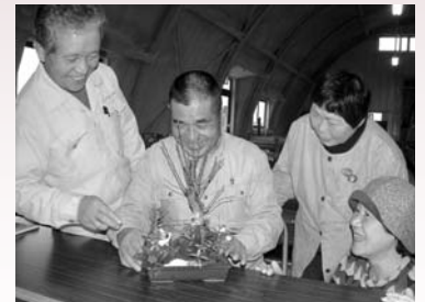
▲昨年の寄せ植えづくり体験

こんにちは！うめぼ～やです。 今回は「寄せ植えづくり体験」だよ。寄せ植えであなただけの小さくきれいな自然世界をつくってみませんか。当日つくった寄せ植えは家で飾ってね。 ぜひ、農業公園でロハススタイル*を体感してね！