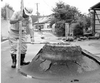
▲60cmも盛り上がったマンホールの状況

8月13日から18日までの6日間、新潟県柏崎市へ本市から災害復旧の応援のため、下水道課職員2人を派遣しました。現地では各地から派遣された職員とともに下水道（農業集落排水）の災害査定設計書の資料作成を行いました。