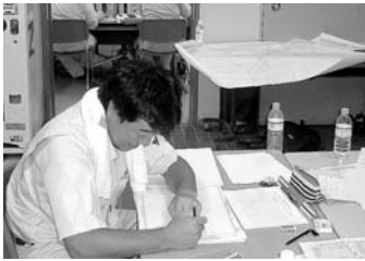
▲災害査定資料を作成