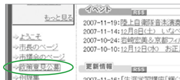
▲トップページ画面 左下