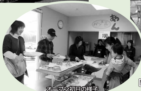
オープン初日の様子