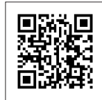
ケータイで見られます▼

託児希望の方：各日の1週間前まで(土・日・祝を除く8:30～17:15)に、下記へお申し込みください。(無料・小学生未満のお子さん・各日10人まで)