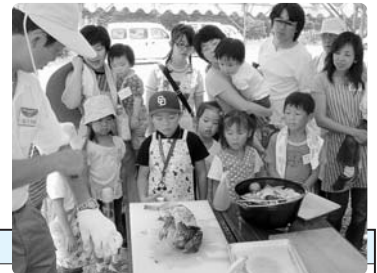
昨年の体験の様子▲

日 時：8月10日(日) 9:30～15:00 (9:15受付) 定員：40人 場 所：梅林公園直売所 (集合場所：梅林公園直売所) 体験料：大人 1,500円/人 子ども(小学生以下) 500円/人 持ち物：エプロン・軍手・茶碗・おわん・箸・コップ・長靴 (雨天の場合：雨カッパ) (参加人数分)