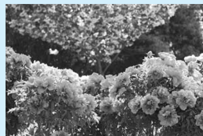
市長賞作品 画題「花競演」

問・申込先 | いなべ市農業公園 | T 46-8377 | F 46-8385