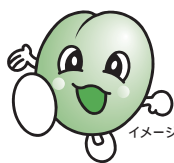
農業公園 イメージキャラクター うめぼ～や

今、いなべのそばがひそかに注目されているよ。今回はいなべ産のそば粉を使って「そば打ち体験」をしま～す。自分で打ったそばは格別！試食もあって、5人前あるからお土産にもなるよ。みなさんぜひ、挑戦してみてね。