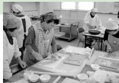
昨年の そば打ち体験