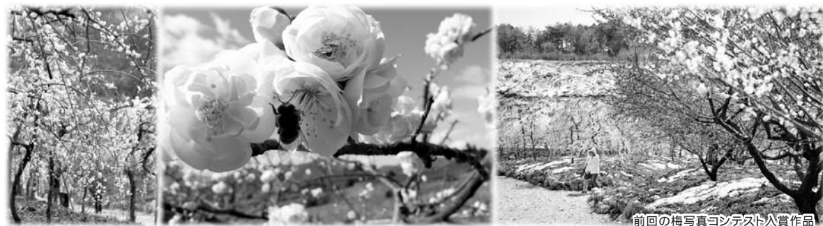
前回の梅写真コンテスト入賞作品

応募期間 3月9日~30日【必着】 応募方法 農業公園へ郵送か持参(各庁舎総合窓口課)市ホームページ(ケータイ含む)のうめ写真応募フォームからも応募もできます。 http://www.city.inabe.mie.jp/filesend.php 選考 審査員 主催者依頼の審査員 発表賞 3月下旬 4月上旬に市ホームページ等で発表します。 入賞者には直接連絡します。 賞 市長賞(1点)いなべづくし(市特産品詰合) 農業公園賞(2点)いなべづくし(市特産品詰合) うめぼ~や賞(3点)梅ジュース(農業公園産) 佳作(5点)ぼたんまつり入園券