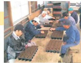
ポット苗を作っています

農家組合が主体となり、この事業が始まる5年ほど前からヒメイワダレソウの植え付けに取り組んでいます。4月にはポットに挿し木をして植え付けの準備を行い約15,000個のポット苗を作り、6月に2,500m 2 ほどのあぜに植え付けました。早くから取り組んでいたこともあり、市内の各地区からたくさんの方が視察に訪れました。7月・8月と順調に生育し、あぜ草刈りの軽減のためにこれからも増やしていきたいと考えています。