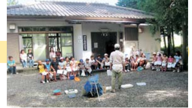
調査前の説明です

8月下旬に守る会役員と子ども会の約30人が参加して、川と通じている排水路の中の生き物調査をしました。水路の中には、アブラハヤやカワヨシノボリなどの魚類、サワガニ、カワナ、トビゲラなどいろいろな生き物がいました。地区内に住む学校の先生が講師になり、先生に教えてもらいながら種類を調べ、冊子にして勉強しました。子どもたちが生き物に触れることで、自然の大切さを感じてもらえたと思います。