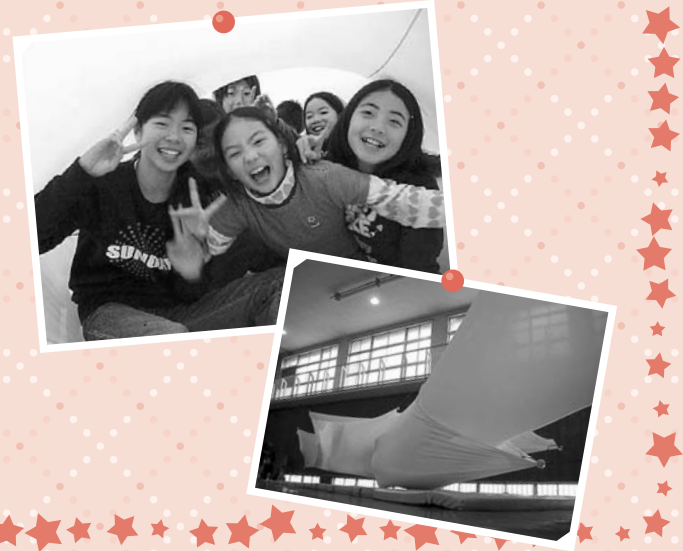
写真は昨年開催した「福祉まつり」のときのもので

スペースチューブとは？ 伸縮性に富む布による「やわらかい空間」です。宇宙航空研究開発機構(JAXA)との共同研究を通してその価値が公式に認知されています。老若男女問わず共通に関心を示すことができる空間モデルとして、国内外から評判を呼んでいます。