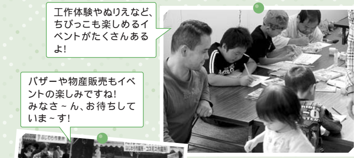
工作体験やぬりえなど、ちびっこも楽しめるイベントがたくさんあるよ!