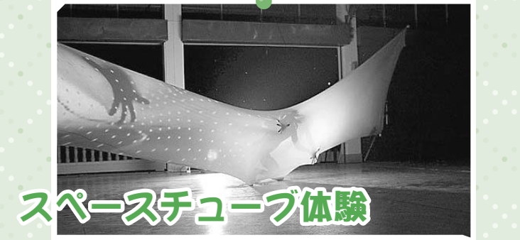
スペースチューブ体験

「お母さんの胎内のような」とも表現されるスペースチューブの中に体を投げ出し宇宙遊泳のように、また魚のようにさまざまな「姿勢」で遊ぶことができる空間です。 スペースチューブとは? 伸縮性に富む布による「やわらかい空間」です。宇宙航空研究開発機構(JAXA)との共同研究を通してその価値が公式に認知されています。老若男女問わず共通に関心を示すことができる空間モデルとして、国内外から評判を呼んでいます。