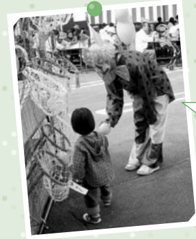
ピエロが細長い風船を使って、動物や飛行機を作ってプレゼントするよ! みんな遊びに来てね!