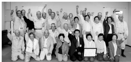
農業公園で活躍するおじいちゃんとおばあちゃん

今回、(社)日本観光協会主催の“花の観光地づくり大賞”で「花を通じて高齢者の生きがいづくりにつながるまちづくりで、来訪者との交流の観点からも新しい観光資源として期待できる」と評価され、審査員特別賞に選定されました。