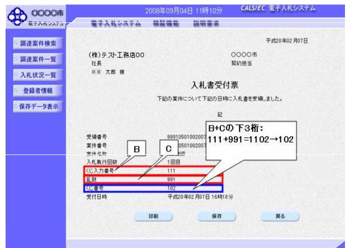
図1. 2. 入札書受付票