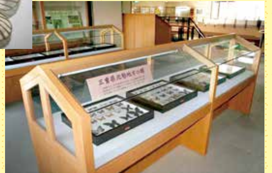
いなべ市のチョウ・トンボ・キノコ・カタツムリ植物化石などをケースで展示