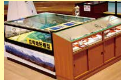
藤原岳周辺の地形と石灰岩の中の化石