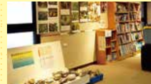
実物にふれて学習。自由に閲覧できる自然関係図書あり