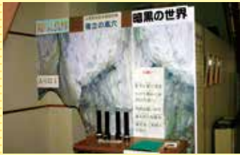
篠立の風穴の自然を再現