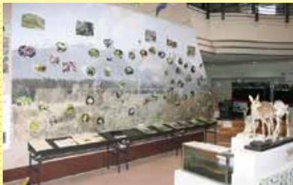
市内の自然環境と、残したい自然を表現