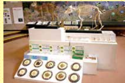
いろいろな動物と、生活の痕跡を展示