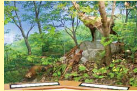
藤原岳にはどんなけものや鳥がいるか、初夏に咲く花や動植物を再現