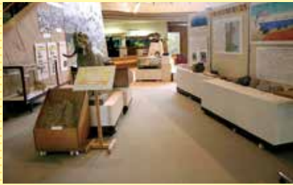
いなべの大地の生い立ちを岩石標本や化石から考える