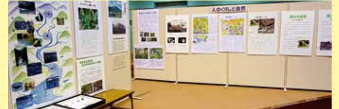
人は自然の恵みで生きている。人の暮らしと自然の関わりを考える