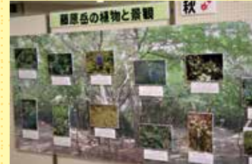
藤原岳に咲く花を季節に合わせて紹介