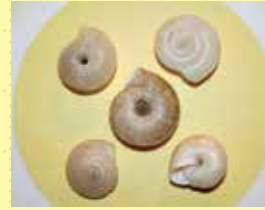
カナマルマイマイ