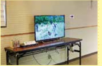
いなべの四季の自然をDVDで紹介