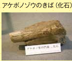
アケボノゾウのきば(化石)