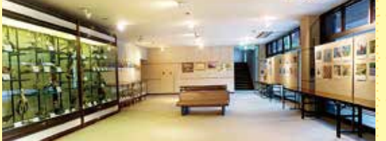
企画展などの開催スペース。常設で野鳥写真等を展示するほか、一般市民の研究や作品も展示