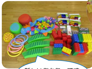
新しいおもちゃです。出前ひろばで遊ぼうね。