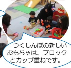
つくしんぼの新しいおもちゃは、ブロックとカップ重ねです。