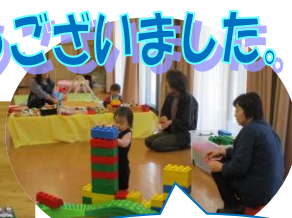
出前ひろばの様子