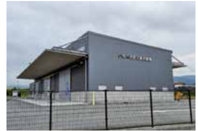
いなべ市防災拠点倉庫