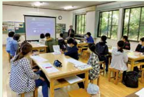
保育士研修のようす

選定理由 保育サービスの提供体制、および多様化する利用者のニーズに対応できる事業となったか事業を検証する。