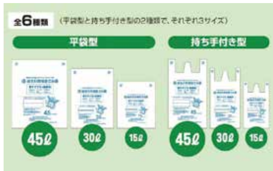
加古川市のごみ袋3種類