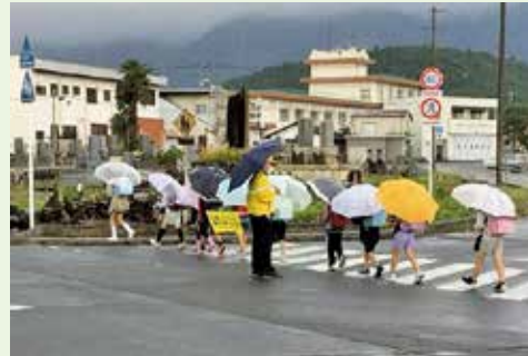
学援隊の見守りの中、通学するようす

選定理由 学校運営協議会が各学校によってどのように運営されたか、および本基本事業に紐づけられた事務事業がどのように連携して事業が進められたかを検証する。