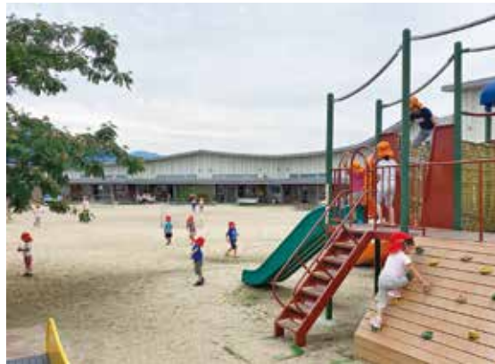
適切な保育園運営をめざして