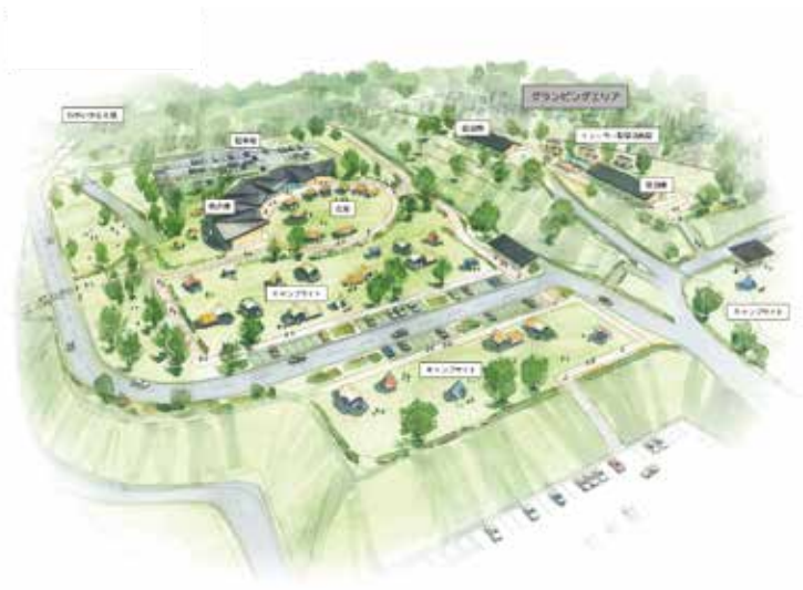
野遊び推進事業計画鳥瞰図 ちょうかんず

A 農業公園へ来られる人と地域の人とのふれ合い、食材の提供、雇用によって効果を生み出そうと考えている。