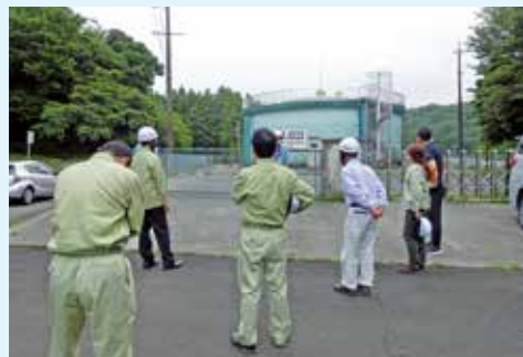
令和2年事業評価のようす

選定理由 老朽化が進む施設の更新作業が適正な計画のもとに進められているか、および防災対策事業が実情に応じたものになっているか、事業を検証する。