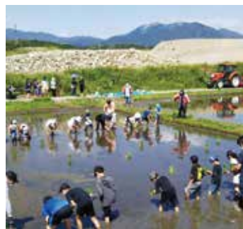
赤米(大安さくら米)の田植え体験をする小学生