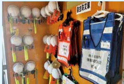
坂本地区自主防災組織の活動より

選定理由 執行された予算によって、災害に強いまちづくりがどれほど進んだか、事業を検証する。