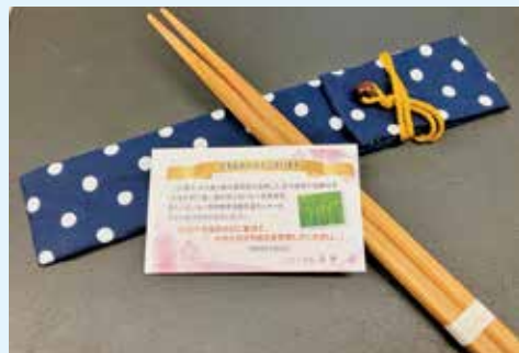
森と緑の基金事業で行う箸の卒業記念品

選定理由 森林が多く占めるいなべ市において、多面的機能を維持するための適正管理ができているか、及び令和6年度から森林環境税が導入されることを踏まえ、みえ森と緑の基金条例が有効に活用できているか、事業を検証する。