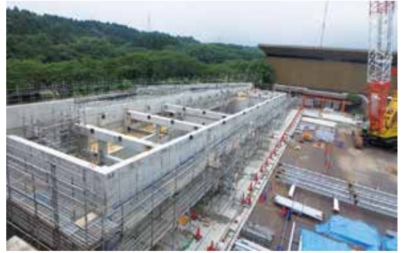
温水プール建設中(令和5年6月現在)