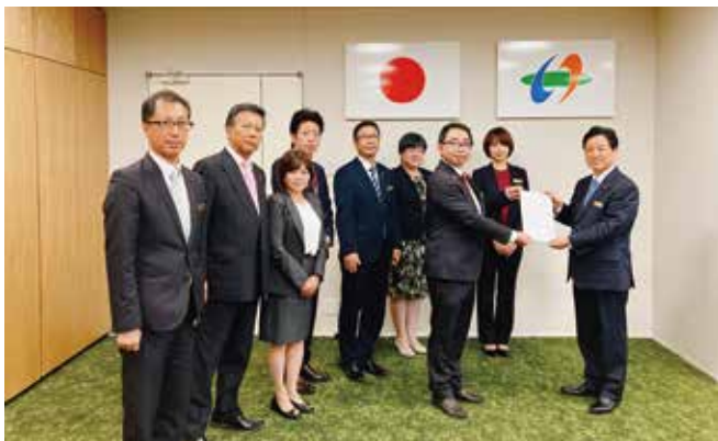
提言を議長へ提出

令和4年4月から都市教育民生常任委員会です 所管事務調査を行ってきた調査事項である「太陽光 発電に関する事項」と、「子育て世帯に関する事 項」のうち給食費無償化に関する提言を、令和5 年3月24日に議長へ提出しました。 これを受け、同日、議長から市長へ提言しました。