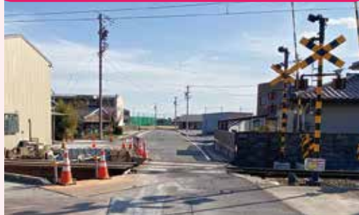
楚原第4号踏切拡幅工事