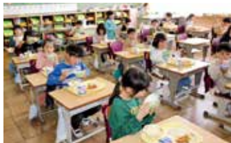
給食費無償化となる小学校の給食風景