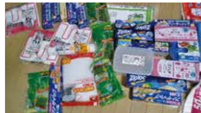
物価高騰対策支援団体活動補助金で購入した物品