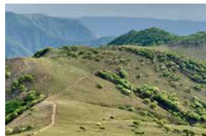
竜ヶ岳に子羊の群れのように咲くシロヤシオの花

A 全国有名ホテルの立ち上げ準備から運営を行っている経験豊富な総支配人をお願いしている。