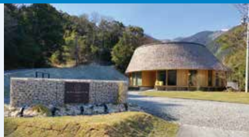
新しくなった宇賀溪キャンプ場 (Nordisk Hygge Circles UGAKEI)