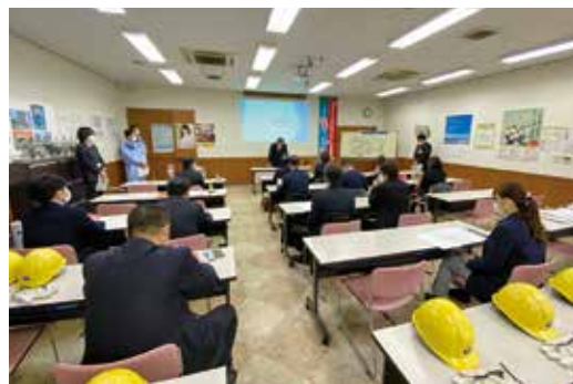
太平洋セメント株式会社埼玉工場視察のようす

太平洋セメント株式会社埼玉工場では、セメント 産業との協働で一般廃棄物処理の導入までの経緯と 現状、仕組みなどの説明を受けました。太平洋セメ ント株式会社藤原工場でも同じ処理ができるのか、 といった質疑などを行いました。