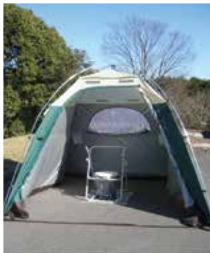
いなべ市のマンホールトイレ