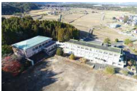
特別支援学校 聖母の家学園いなべ分校 (旧東藤原小学校)