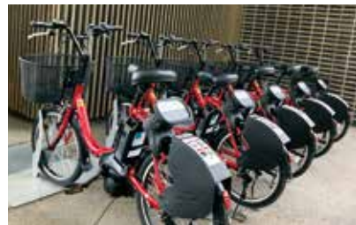
にぎわいの森のレンタサイクル「いなチャリ」