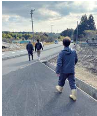
猿追払い隊による定期パトロール(北勢町飯倉)

A 今後、自治会長へリーダーの選任を依頼する予定。保育園、小・中学校の保護者へ「猿の対策実践マニュアル」と「ロケット花火・爆竹無償配布」のチラシを配布し、学校長を通じて学援隊・PTA・子供会に追払いや登下校の見守りを行ってもらうよう協力を要請。