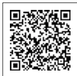
↑録画配信サイトへ