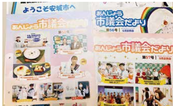
視察先の議会だよりの

他市町の議会だよりの編集方法を学び、今後のい なべ市議会だよりの編集に役立てていきます。