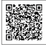
↑録画配信サイトへ