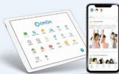
保育現場で取り入れるアプリケーション