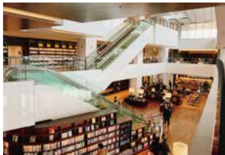
神奈川県大和市「文化創造拠点シリウス」

2月8日、都 市教育民生常任 委員会の所管事 務調査で、神奈 川県大和市の市 立図書館（文化 創造拠点シリウ ス）へ、また、