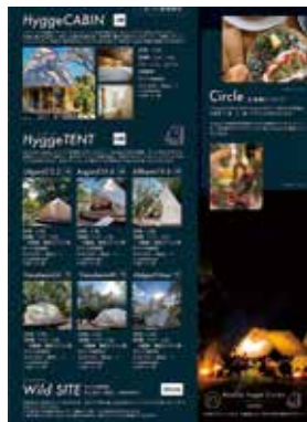
新しい宇賀溪キャンプ場のパンフレット