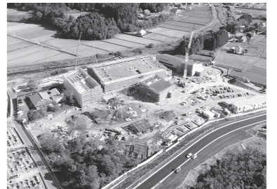
▲新庁舎建設状況(平成30年11月20日撮影)

交付日の4日前までに市民課に予約が必要です。また、通知カードをまだ受け取りされていない人で休日受け取りを希望する場合も、事前連絡が必要です。