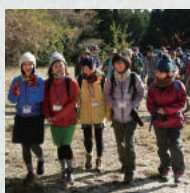
※#1、#2のどちらかを選択

アウトドアブランド「AXESQUIN」のスタッフがレクチャーする「凌ぎ」で外遊びしませんか？ハンモックを張ったり、ジャンボしゃぼん玉体験や、フォト講座など、森の中でのんびり楽しく過ごしましょう。森の中におしゃれなカフェもオープン。定員30名。